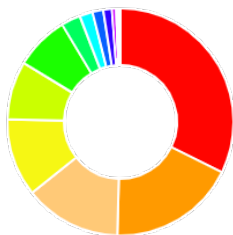
Eventi per Tipo (dati: 01/10/2023 - 31/12/2023)