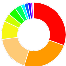
Eventi per Tipo (dati: 01/01/2023 - 31/03/2023)