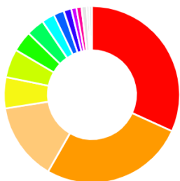
Eventi per Tipo (dati: 01/04/2022 - 30/06/2022)