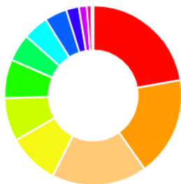
Eventi per Tipo (dati: 01/01/2026 - 31/03/2026)