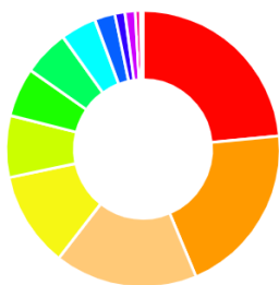
Eventi per Tipo (dati: 01/10/2025 - 31/12/2025)