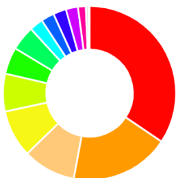
Eventi per Tipo (dati: 01/07/2024 - 30/09/2024)