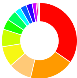
Eventi per Tipo (dati: 01/04/2024 - 30/06/2024)