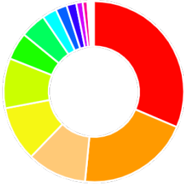
Eventi per Tipo (dati: 01/01/2024 - 31/03/2024)